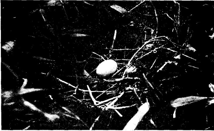
Fig. 1.— Chloroenas araucana (Less.). Nombre araucano: «Kono». Nombre chileno: «Torcaza». — Ave abundante en todo el sur de Chile. Durante el invierno anda en bandadas, a veces de centenares. El nido es una simple plataforma de palitos, en cima de cañas, a 1 metro 20 del suelo. De todos los nidos observados durante diez años uno solo tenía dos huevos y todos los demás uno solo.

Fotografía tomada el 10 de Noviembre de 1911.