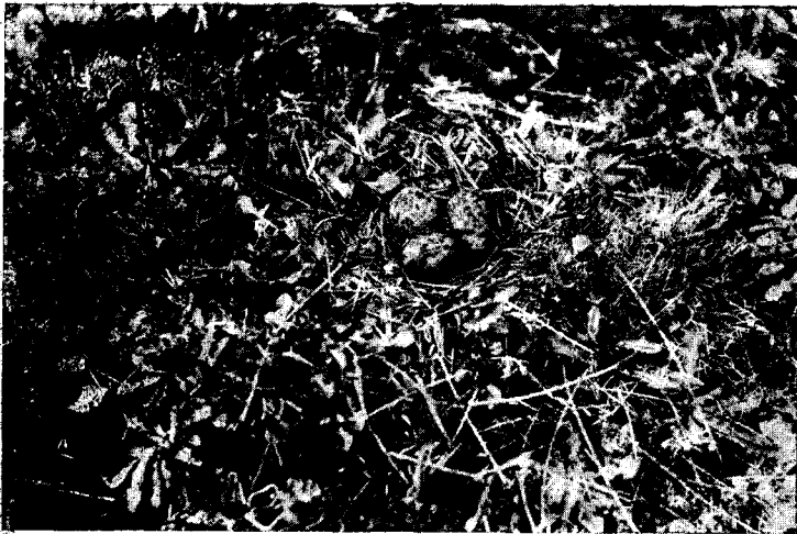
Fig. 4.— Belonopterus cayennensis chilensis (Mol.). Nombre araucano: «Tregül». Nombre chileno: «Qultegue», y «Tregle». El Teruteru es ave abundante en todas partes. El presente nido era tan solo una leve cavidad en la tierra con algunas briznas de pasto seco. En el mismo lugar se había sacado antes un nido con cuatro huevos; siendo éste, sin duda, el segundo nido de la misma pareja. Fotografía sacada el 18 de Noviembre de 1911.