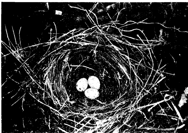
Fig. 8.— Curaeus curaeus (Mol.). Nombre araucano: «Küren». Nombre chileno: «Tordo». — Ave común y como la anterior dañina para los sembrados de trigo y de maíz. Nidifica en las cañas, a unos tres metros del suelo. La postura habitual es de 3 a 4 huevos.

Fotografía tomada el 4 de Noviembre de 1903.