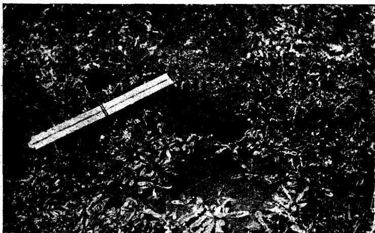
Fig. 6.— Pygochelidon patagonica (Orb. et Lafr.). Nombre araucano: «Pillmaiquen» o «Húshilkon». Nombre chileno: «Golondrina de la Cordillera». — Común en algunas regiones. Hace un hoyo en la tierra, de un metro a uno y ochenta centímetros de profundidad, terminándolo a veces en unos 60 cms. He observado hoyos en un terreno enteramente llano, aunque había a unos 200 metros del lugar un cerro de 40 metros de altura. La entrada era de 9 \times 65 cms. El nido está hecho de pasto y plumas en el interior. La postura es de 4 a 5 huevos, enteramente blancos. Todos los nidos fueron encontrados en Octubre y Noviembre.

Fotografía tomada el 18 de Noviembre de 1911.