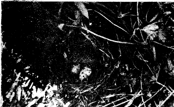
Fig. 7.— Trupialis militaris (Linn.). Nombre araucano: «Lloica». Nombre chileno: «Loica». — Ave común en todas las regiones. Hace bastante daño en los campos de maíz y de trigo recién sembrados. Nidifica siempre en el suelo, entre el pasto, cerca de alguna mata.

Fotografía tomada el 4 de Noviembre de 1903.