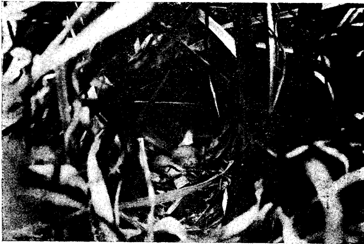
Fig. 2.— Pardirallus ryrirhynchus sanguinolentus (Sw.). Nombre araucano: «Pidén». Nombre chileno: «Pidén». — Ave bastante común en los pajonales de toda la región. Se oye con frecuencia su grito, pero es muy difícil verla. Construye su nido con la paja que crece en las lagunas, y a unos 40 centímetros sobre el agua. El diámetro interior es de 15 a 18 cent., y la profundidad de 5 cent.

Fotografía tomada el 10 de Noviembre de 1911.