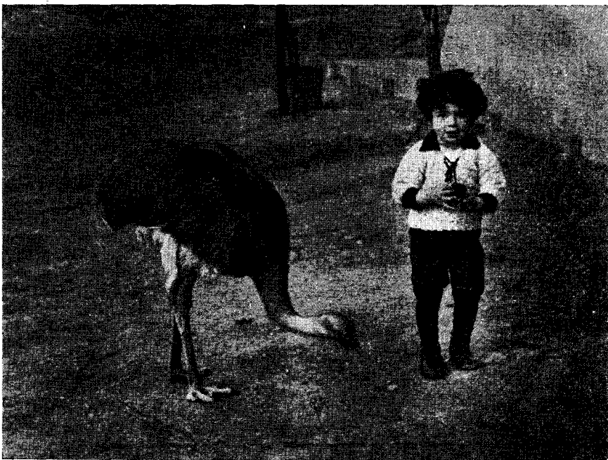
Avestruz petizo ( Pterocnemia pennata ).

hembra pone una docena de huevos y aún más (1) . Es común hallar 30 ó 60 huevos en un mismo nido, pero a veces se encuentra mayor cantidad, y he sabido de uno que contenía, al ser hallado, 120 huevos. Si las hembras son numerosas, el macho generalmente se vuelve clueco antes que ellas terminen de poner y, entonces, las expulsa furiosamente y empieza a incubar. Las hembras depositan entonces los huevos por los alrededores, en la llanura; a juzgar por el gran número de huevos dispersos hallados parece probable que sean más los puestos fuera del nido que los que se hallan en él. El huevo fresco es de un bonito amarillo dorado, pero este