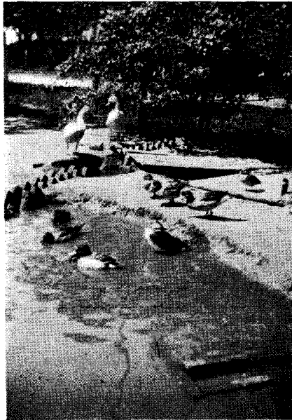
FIG. 2. — Otro aspecto del mismo criadero.

En el segundo grupo comprendo al pato colorado ( Querquedula cyanoptera ), pato argentino ( Querquedula versicolor ), espátula ( Spatula platalea ) y el cisne cuello negro ( Cygnus melanocoryphus ). Creo comprender que los palmípedos de este grupo, son mucho más acuáticos que los del primero; de un carácter menos dulce, soportan poco la vecindad de un congénere y debe el criador atender muy cuidadosamente la alimentación a fin de hallar la que más convenga a su naturaleza. Al decir que son más acuáticos, quiero significar que permanecen casi siempre en el agua y una