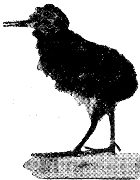
FIG. 2. — Pichón de la becasina, Gallinago paraguayana , de dos días.

negra subapical y terminando con ribete leonado y blanco; pico de 70 mm. de extensión, oliváceo con ápice negro; y tarsos oliváceos. La hembra es semejante; y los pichones, tienen el plumón castaño, todo moteado de negro, y dos fajas longitudinales negras sobre la cabeza; pico y patas negros. Los huevos, de coloración muy semejantes a los del tero común; pardo amarillento oliváceo con máculas castaño y oscuras, y una zona cerca del polo agudo casi sin máculas, y son algo satinados. Dimensiones: 31 \times 41 y 30 \times 45 .