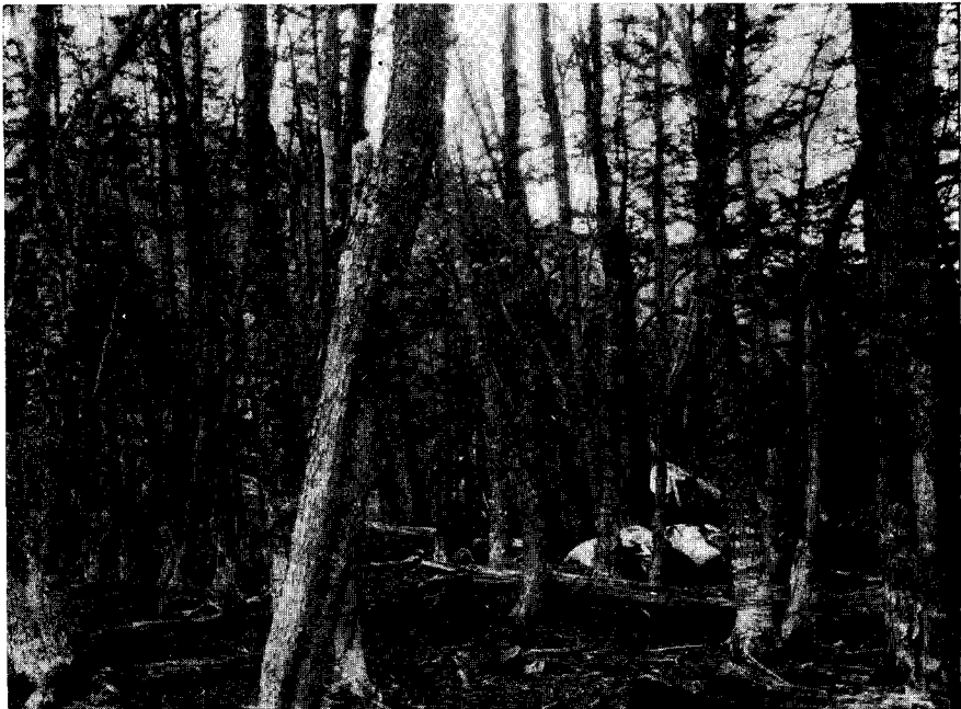
FIG. 4. — Tierra del Fuego. Lugar del bosque en el camino entre Ushuaia y el lago Cami al que se hace referencia en la pág. 393.

Desc. — Pico córneo con el maxilar superior más obscuro y patas isabelinas. Por abajo, de ese color y la base de las plumas negras; por arriba uniformemente estriado, en sentido longitudinal, de obscuro e isabelino. Remiges oscuras, las últimas cubitales con manchas bayas y negras en las barbas externas. Timoneras manchadas de barras transversales negruzcas y amarillento sucias.