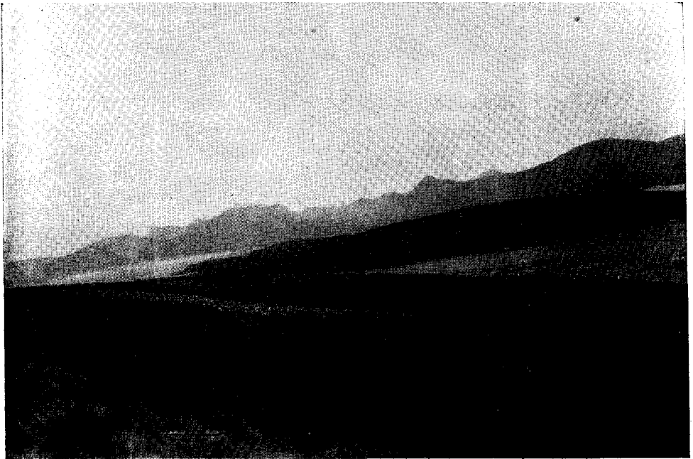
FIG. 1. — Islas de Año Nuevo: isla del Observatorio. Arriba. Grupo de Phalacrocorax albiventer en la costa, al fondo los montes de la isla de los Estados. Abajo: Las fajas de puntos blancos son agrupaciones de la misma especie; al frente la Isla Zeballos y al fondo la de los Estados.