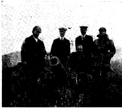
FIG. 3. — Isla de los Estados: Bahía San Juan, Punta Laserre. Cañoncito ocupado por el nido de Cistothorus platensis hornensis .

Obs. — En los bosques de coihue de la Isla de los Estados, p. ejemplo, Puerto Cook y Puerto Roca, he oído y cazado este pequeño Tiránido. Infatigable cantor que se oculta en la espesura y si allí es molestado por la presencia del hombre, vuela a otro sitio más protegido y sigue sus arpegios interrumpidos.