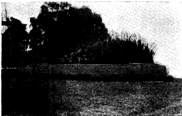
FIG. 1. — Tanque con pajas en las que suele anidar una colonia del tordo de laguna, Agelaius ruficapillus . (Zelaya).

Aves nuevas para la provincia de Buenos Aires. — El 24 del mismo mes, aparecieron en el jardín de la quinta de mi familia en Zelaya, un casal del hermoso picaflor, Sappho sappho . Es uno de los picaflores más hermosos, cuyo habitat es Córdoba, Tucumán y La Rioja.