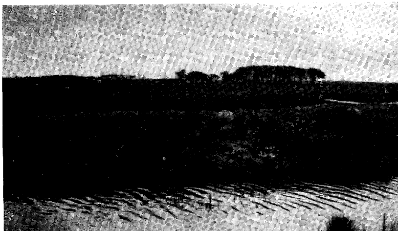
Fot. N° 2. — Nido de hornero adosado a la pared de un arroyo, en Zelaya, y destruido antes de que comen- zaran la postura, junio de 1939.

De manera que si se señalaran a los casales de las distintas especies de aves que anidan o frecuentan un lugar determinado y luego se observaran, se vería que siempre son los mismos los que vuelven a ocupar ese lugar o próximo a él, todos los años, y en las aves migratorias, como los churrinches, Pyrocephalus rubinus ; tijereta, Muscivora tyrannus ; otros tiránidos, golondrinas, etc., son siempre los mismos casales los que frecuentan en la misma época, los mismos lugares, y hasta en los grandes migradores, como los chorlos, no me cabe la menor duda que las mismas bandadas