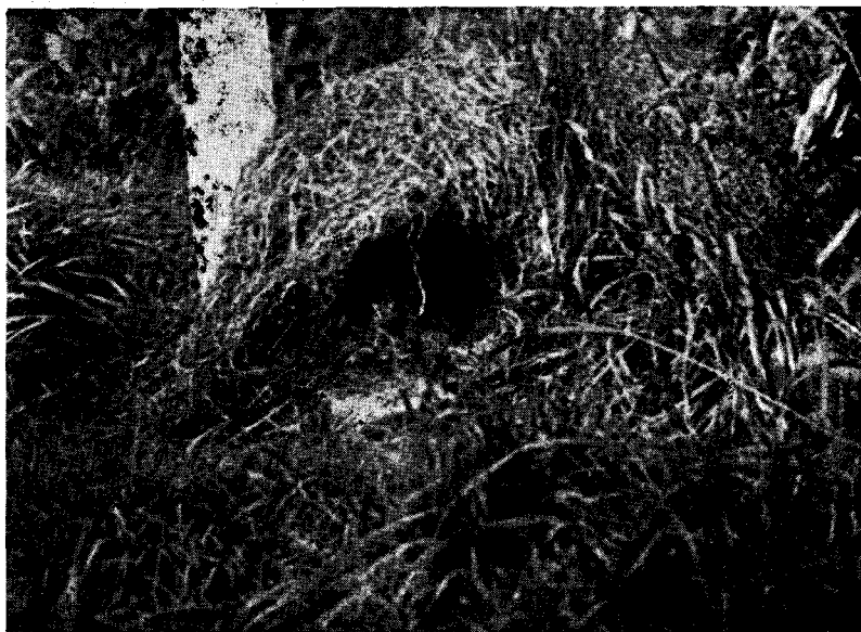
FIG. 4. — Macho de perdiz colorada incubando.

De acuerdo con esta observación, un poco tardía, desgraciadamente, sobre la psiquis de estas perdices, alejé a uno de los dos machos que quedaban, y el que dejé con las hembras, se echó cuando éstas empezaban a