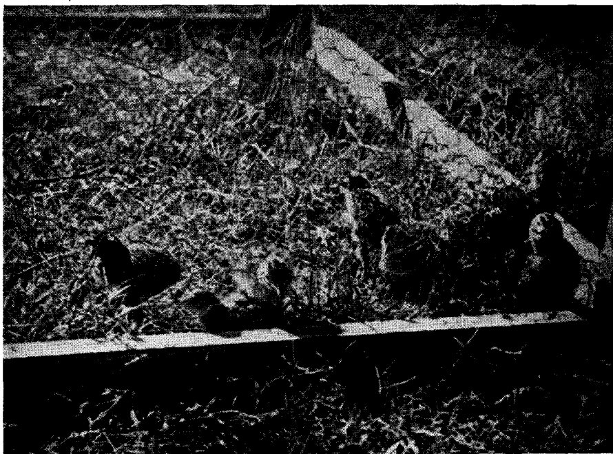
FIG. 2. — Pichones de perdiz colorada en su jaula. (Moreno F. C. O.).

se colocaron algunos cajones bajos y largos, con pequeñas aberturas para que también pudieran servir de nidos en caso de preferirlo así las perdices. Estas nunca han puesto sino fuera de la casilla, a cielo abierto, en una pequeña depresión del terreno, que ellas mismas hacen con las patas y el cuerpo, para lo cual adoptan la posición de semiechadas al mismo tiempo que giran sobre sí mismas suavemente. El giro lo hacen alrededor de un eje vertical y la operación dura pocos minutos; si el lugar elegido es muy duro, buscan otro, pero siempre tratando que el futuro nido quede semi-oculto entre los yuyos o matas de paja.