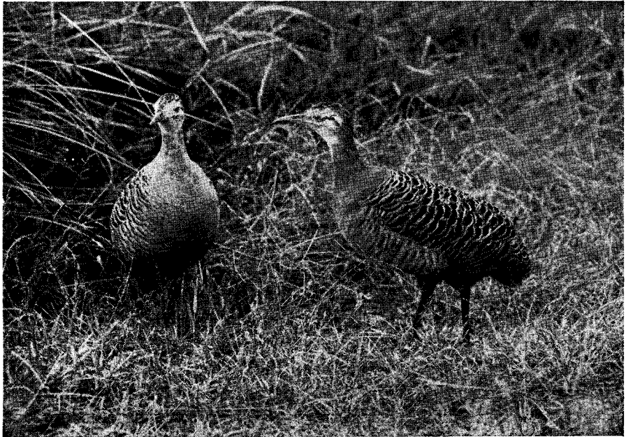
FIG. 1. — Pareja de perdiz colorada ( Rhynchotus rufescens ). Preparación y foto de Antonio Pozzi.

En el artículo anterior, decía que de doce ejemplares silvestres que tenía de esta perdiz, me habían quedado nueve que encerré en un parquecito de 20 × 20 metros en el que había una casilla para que pudieran escon-