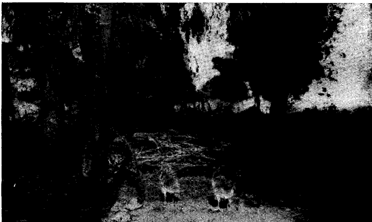
For. N° 1. — Pichones de chajá traídos de General Lavalle en 1936.

Ya adultos y bien emplumados, se suponía fueran casal, pues siempre andaban juntos, siendo uno de ellos más celoso de su compañero y aunque