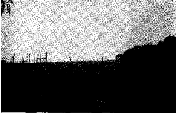
For. N° 3. — El casal de chajaes, donde se ve a la hembra echada en su segundo nido.

pasaban con su paso majestuoso, observándolo todo, siempre vigilantes, y deteniéndose frente a la cocina de la casa, miraban hacia adentro a ver si alguien les alcanzaba su ración preferida, algún postre con leche,