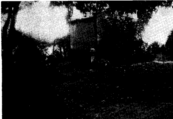
For. N° 4. — El pichón de chajá echado a la sombra del padre adoptivo.

El que suponíamos macho, más volador, gustaba subirse siempre sobre una eminencia, tronco de árbol o el techo de un gallinero, en donde se quedaba bastante tiempo en observación.