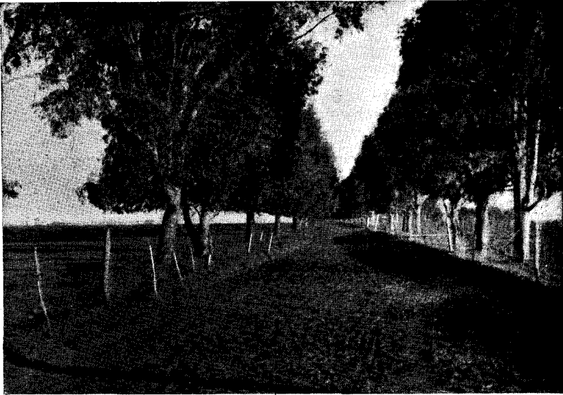
FIG. 2. — Avenida con variedad de Eucaliptus, en « La Aurora », Zelaya (Buenos Aires), a donde acuden como enjambres las abejas para librar en sus flores. (Fot. de T. GILBERT PEARSON).

En lo que disiento con el autor es en las otras aves, que, según él, ocasionalmente hacen polinizaciones, al buscar en las flores los jugos azucarados o van a ellas a chupar el néctar o comer polen, mencionando a las siguientes especies de Chile: tordo común Notiopsar curaeus (Molina), el más activo de los pájaros comedores de insectos, siguiéndole en actividad la tenca Mimus thenca (Molina), el fio fio Elaenia albiceps chilensis Hellmayr, el zorzal Turdus falklandii magellanicus (King), el cometocino grande Phrygilus gayi gayi (Gervais), el tordo argentino