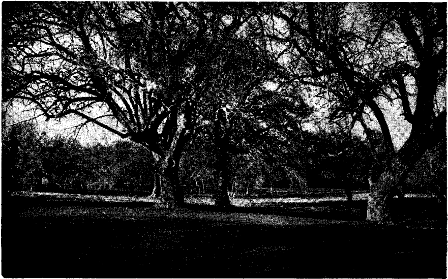
FIG. 5. — Añosos talas del parque de la estancia « Juan Jerónimo », donde anidan numerosas especies de aves.

Como árbol típico, propio de esas costas, sobre terreno de conchillas y medanoso, tenemos al tala Celtis spinosa , que forma en parte bosque tupido, asociado a otras plantas; y que en algunos lugares como en Punta