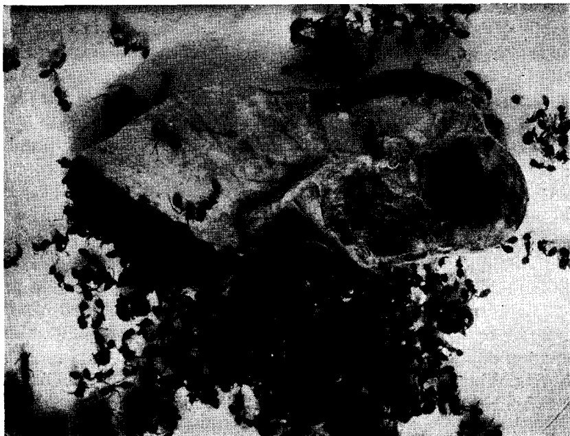
Fragmento del canal digestivo de Chrysotilus leucofrenatus perplexus (Cory), conteniendo más de 1000 «hormigas coloradas» del género: Solenopsis .

Dorso listado transversalmente en castaño oscuro y verde, o castaño y anaranjado, o castaño y blanquecino. Los colores verde y naranja pueden estar más o menos mezclados o diluidos hasta casi desaparecer; en este último caso las listas claras son blanquecinas. En melanochloros melanochloros las listas claras y las oscuras son aproximadamente del mismo ancho; en los otros, en general, las listas oscuras son dos veces más anchas que las claras.