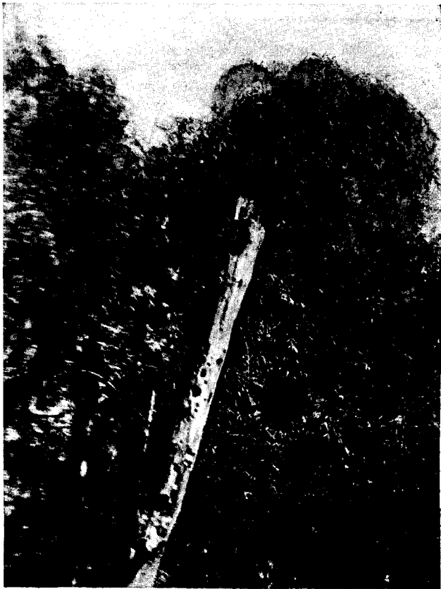
Nido de Chrysophilus leucofrenatus perplexus (Cory) en álamo seco, colectado por Salvador Magno en « La Esperanza » sobre el río Capitán (Delta).

Habita: En el noroeste de la provincia de Buenos Aires y sud y oeste de Entre Ríos, extendiéndose hacia el Uruguay (en todo el Delta).