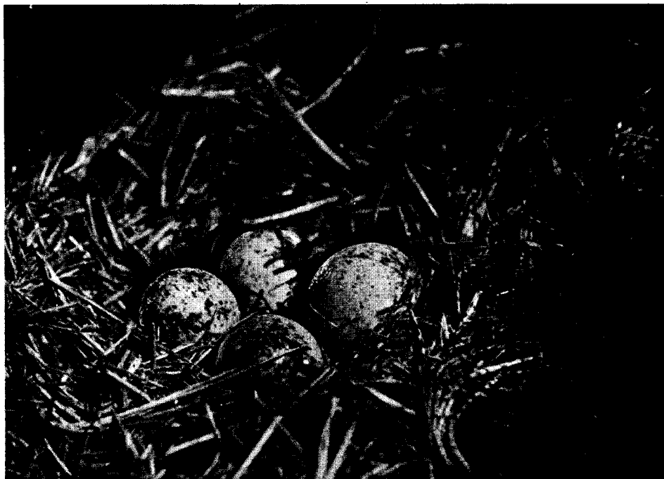
Nido y huevos del Chorlo Juancho o Poccoi Thinocorus orb. orbignyianus Lesson

Fotografías tomadas en Estancia "Viamonte", Tierra del Fuego, por el Sr. R. T. Reynolds.