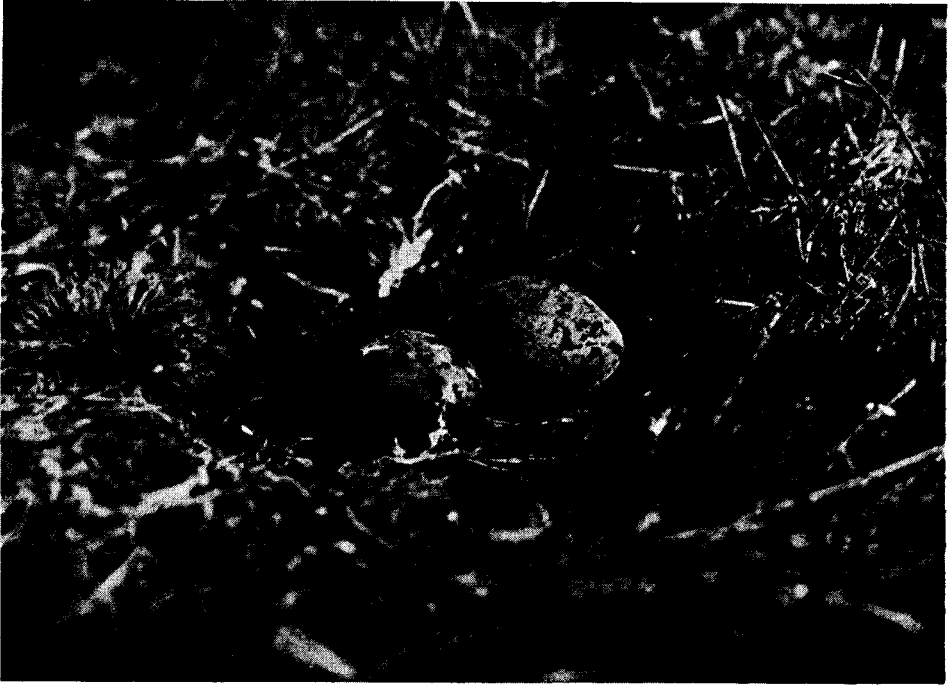
Nido del Chorlo Cabezón Oreopholus ruficollis (Wagler)

Fotografía tomada en Estancia "Viamonte", Tierra del Fuego, por el Sr. R. T. Reynolds.