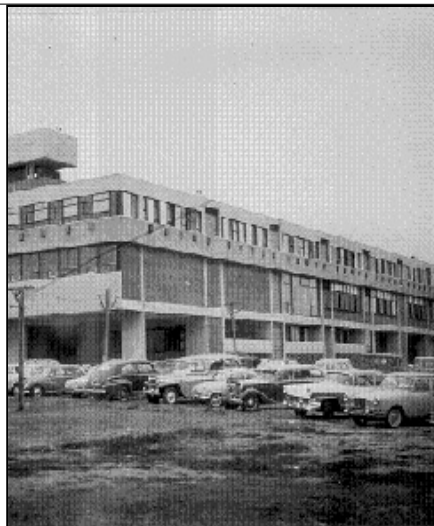
El Pabellón I de la Ciudad Universitaria en 1964. Desde aquí se transmitían las clases, mediante un enlace de microondas, hasta el edificio de Perú 222.

Pero no sólo se trataba de fomentar el espíritu crítico en la disciplina de estudio. El marco de referencia del planteo pedagógico era más amplio aún. Luego de explicar la necesidad de combatir las deformaciones que traen los estudiantes del colegio secundario "(memorización y repetición, "rata", copiarse, falta de espíritu crítico, carencia de métodos de estudio,