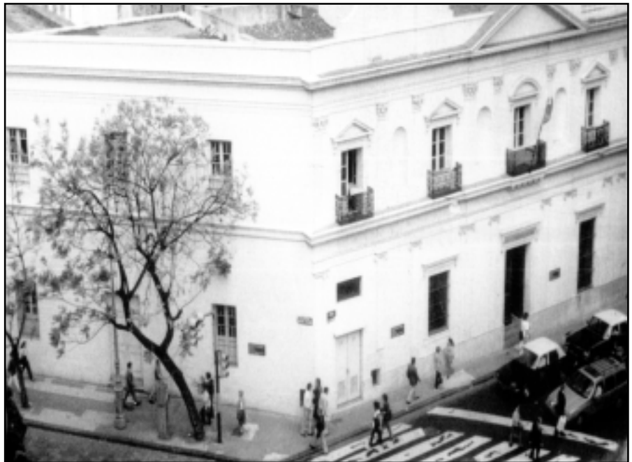
El edificio de Perú 222, donde se dictaba el Curso de Ingreso.