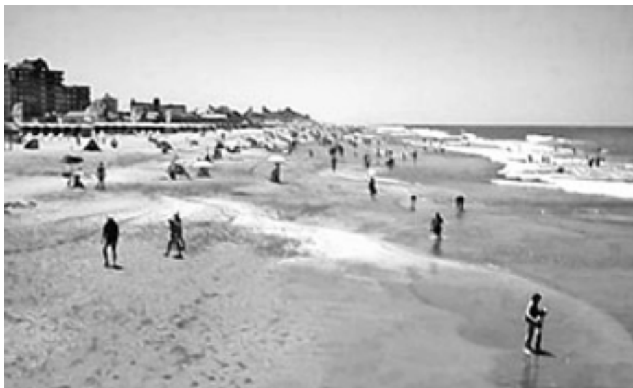
Playa de Villa Gesell

Además, se garantiza información sobre la calidad del agua, la cual deberá ser analizada cada 15 días por cada balneario que se ajuste a la normativa, y se avisará al público si