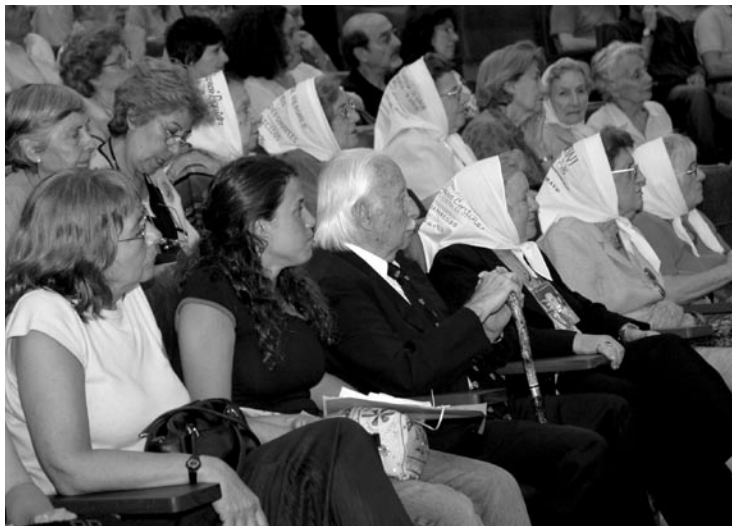
Un grupo de Madres de Plaza de Mayo (Línea Fundadora) en el acto