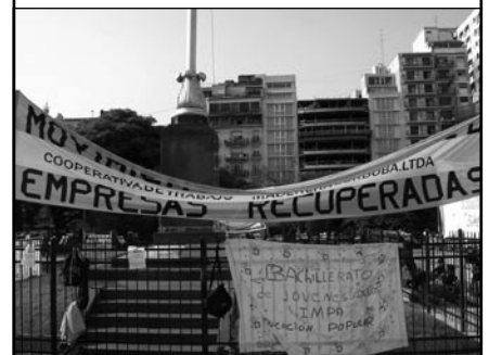
Nota y foto: Agencia Conosur www.proyectoconosur.com.ar