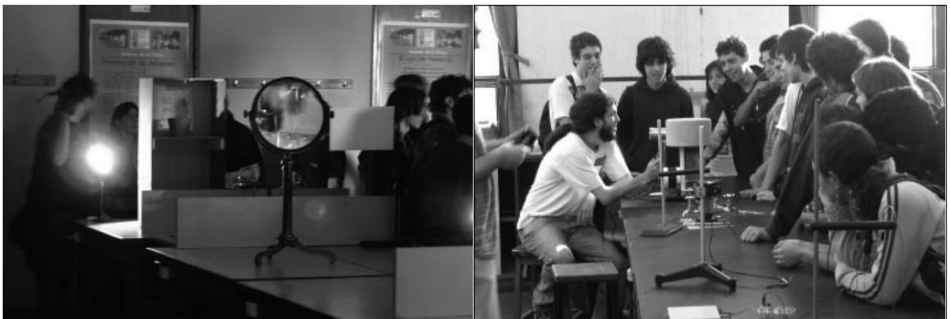
Actividades desarrolladas en el Departamento durante la Semana de la Física 2006

El grupo también trabaja con otro acelerador, el TEBATRON del Laboratorio Fermi de los Estados Unidos, con el cual se han descu-