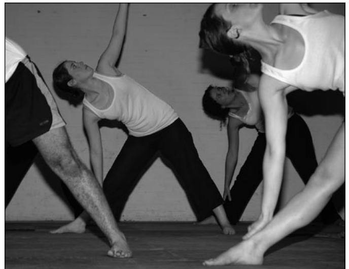
Instantáneas de la muestra de deportes