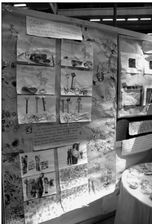
Un panel con trabajos de los chicos