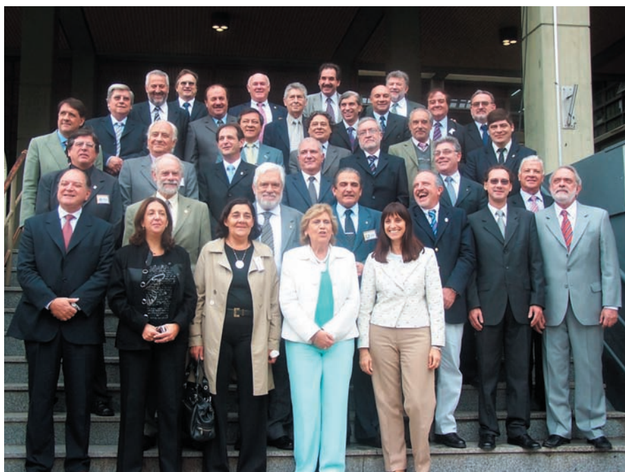
Los rectores del CIN, posando después del plenario de San Luis.

Ahora hay que ver qué pasa también con la universidad a la que le toque ese desmembramiento. Puede ocurrir que se considere lesionada en su patrimonio y recurra a la Justicia en el marco de la autonomía universitaria. Hay que tener en cuenta que la opinión del CIN, de acuerdo con lo reglamentado, no es vinculante, pero si se nos pide es porque los senadores tienen que cumplir con ese paso y deberían hacer el análisis posterior que corresponda. Finalmente, corre por cuenta de ellos qué decisión van tomar.