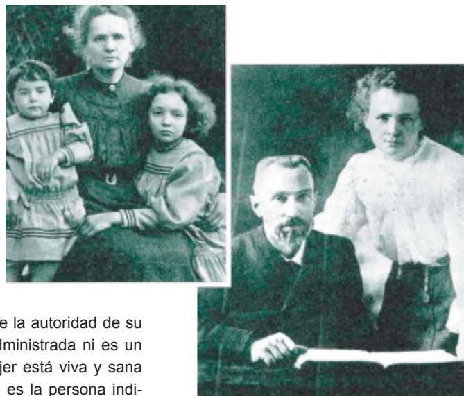
Marie Curie, contraejemplo de las consideraciones de Olive Thomas: cient fica y madre. Sufri  una dura discriminaci n.