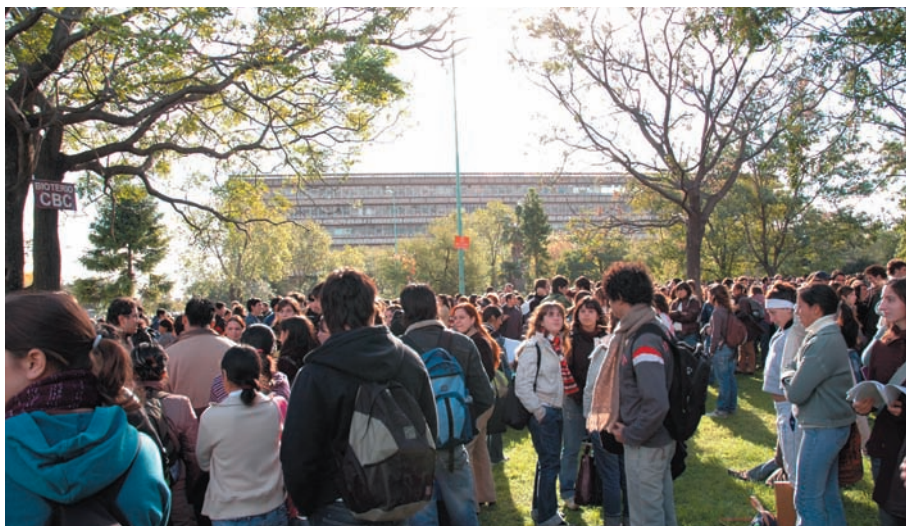
Integrantes de la Facultad esperan en los puntos de reunión

Organizado por el Servicio de Higiene y Seguridad, se llevó a cabo un nuevo ejercicio de evacuación en el Pabellón II. Satisfacción por el comportamiento general de la gente. Quedan puntos por mejorar.