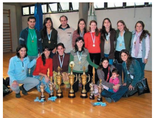
Equipos de natación y hockey campeones en el certamen 2006

Todos los interesados en representar a la Facultad tienen que ponerse en contacto con el Área de Deportes, e-mail: deportes@de.fcen.uba.ar