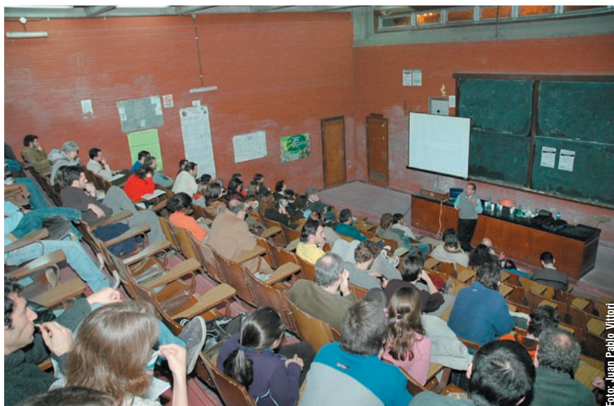
El encuentro tuvo lugar en el aula 1 del Pabellón II

Martín Isturiz comenzó su exposición aclarando que tenía algunas diferencias con Barañao y afirmó que del análisis del Plan Nacional de Ciencia y Tecnología 2006-2010, surge que no cuenta con proyectos públicos estratégicos, que son aquellos que "permiten la autodeterminación de un país, ni con planes a nivel nacional que apunten a resolver necesidades sociales". "Eso es inexistente", sostuvo y agregó, "yo creo que el eje del Plan promueve