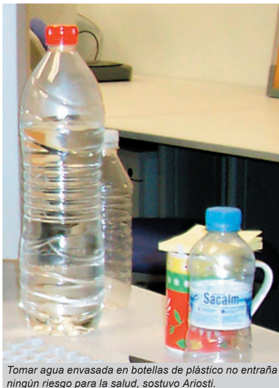
Tomar agua envasada en botellas de plástico no entraña ningún riesgo para la salud, sostuvo Ariosti.