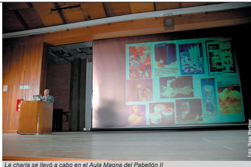
La charla se llevó a cabo en el Aula Magna del Pabellón II

El primer mensaje plantea que si se introducen los “tuppers” en un horno a microondas, al calentar la comida, se generan dioxinas que pasan del envase a los alimentos. Esta aseveración reviste una enorme gravedad ya que las dioxinas son