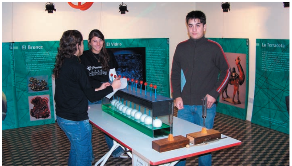
Propagación de ondas, construido por alumnos bajo la dirección de Armando Zandanel