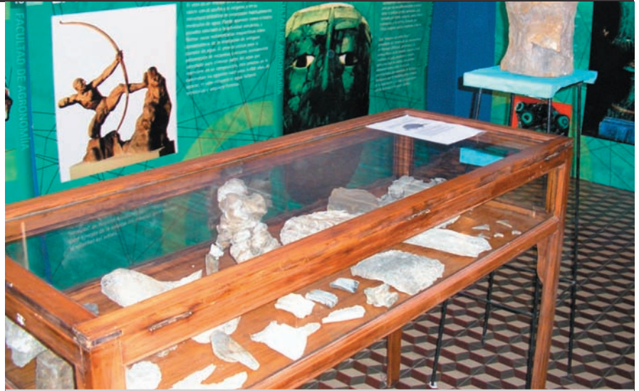
Muestra paleontológica que reconstruye la megafauna del cuaternario, a cargo del Club de Ciencias César Milstein, de la Facultad de Ciencia y Tecnología, de la Universidad Autónoma de Entre Ríos.