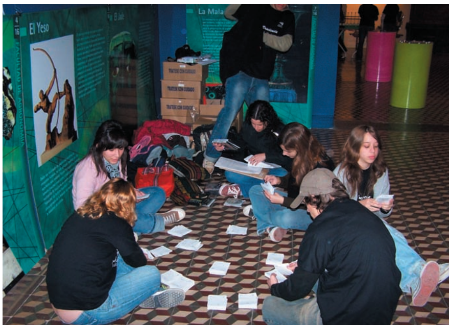
Alumnos secundarios de Chivilcoy participan de la muestra.