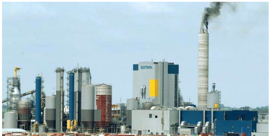
El humo negro que despidió la chimenea señaló la puesta en marcha de la planta, el último fin de semana.