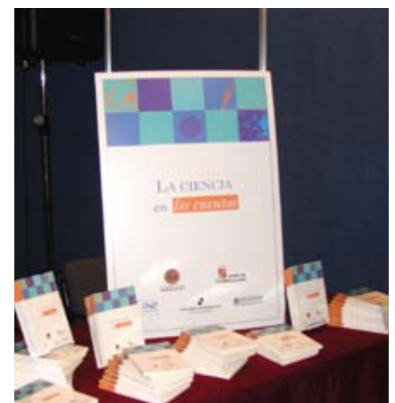
Portada del libro que reúne los cuentos ganadores de la edición 2006.

El concurso fue convocado por el Instituto de Astronomía y Física del Espacio (IAFE/ CONICET) y la Asociación Civil Ciencia Hoy, con el auspicio del Programa de Promoción de la Lectura del Ministerio de Educación de la Argentina, el Centro de Formación e Investigación en Enseñanza de las Ciencias (CEFIEC/FCEyN-UBA), el Laboratorio Cero (CNEA/UNSAM) y el Área de Ciencias del Centro Cultural Borges.