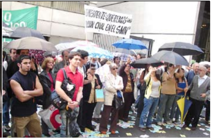
A mediados de octubre del año pasado, se llevó a cabo un "paraguazo" de protesta, para repudiar la intervención militar y reclamar la inmediata restitución del SMN a manos civiles.