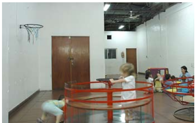
Las obras posibilitarán que el Cefiec tenga un nuevo espacio en el 2º piso. En relación con el Jardín se quitarán las paredes internas de madera, que serán reemplazadas por placas de yeso y también se realizará un cielorraso en su patio central.