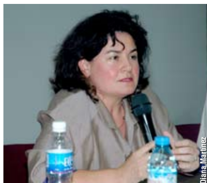
Noto subrayó que lo fundamental es trabajar mucho con el docente. "Ese trabajo hay que ir haciéndolo de a poco. No se pretende hacerlo un experto en biología o física, sino que el docente se apropie de cómo enseñar ciencia en relación a lo que dispone la currícula".

Entre los principales problemas que afectan a la escuela media, la especialista subrayó la deserción y señaló que entre sus motivos aparecen problemas económicos y familiares pero también la falta de interés y el bajo desempeño. "Los dos primeros son claramente políticos pero sobre los otros dos ¿no podemos hacer nada los docentes?", se preguntó. "A veces se apunta a retener a los jóvenes a cualquier costo, en una suerte de asistencialismo —agregó—. Tenemos que apuntar a la alfabetización científica de