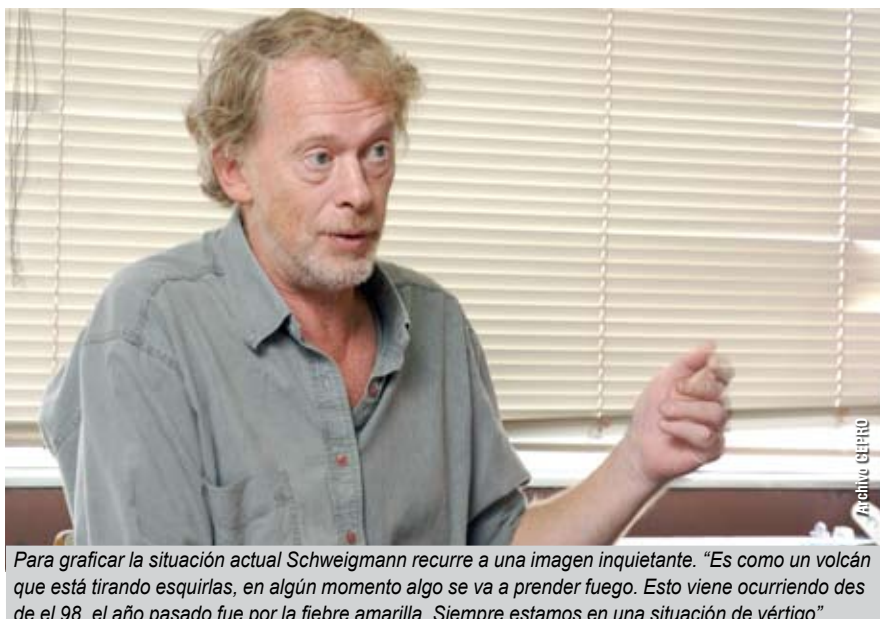
Para graficar la situación actual Schweigmann recurre a una imagen inquietante. “Es como un volcán que está tirando esquilas, en algún momento algo se va a prender fuego. Esto viene ocurriendo desde el 98, el año pasado fue por la fiebre amarilla. Siempre estamos en una situación de vértigo”.