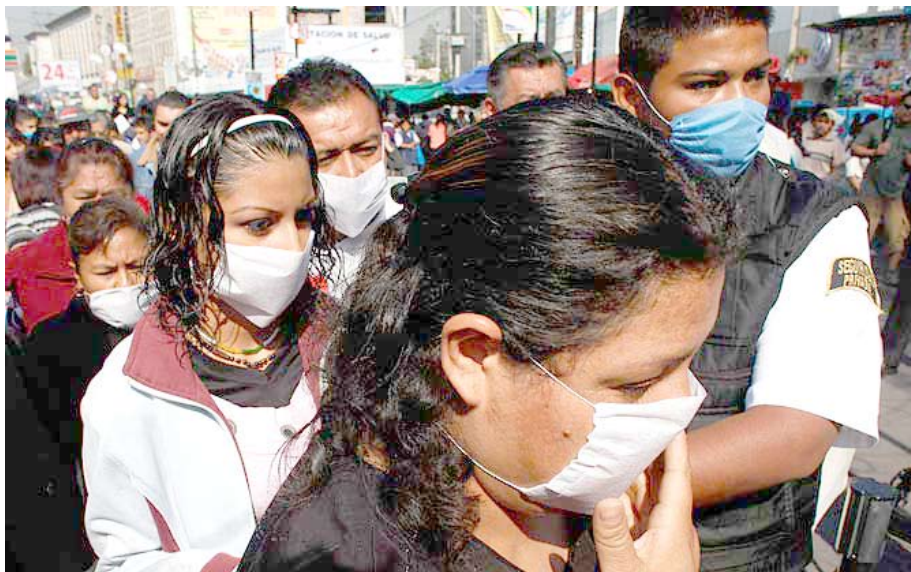
Pág. 2 ►

Hace años que se pronostica una pandemia. Las hipótesis acerca del agente que la causaría apuntaban principalmente a un híbrido que surgiría de la mezcla de virus aviares y humanos. Sin embargo, los resultados preliminares del análisis genético indican que el nuevo virus sería el resultado de la recombinación de dos cepas porcinas que infectan habitualmente a los cerdos de Norteamérica y Eurasia.