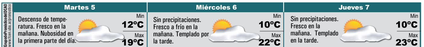
Pág. 6 ►