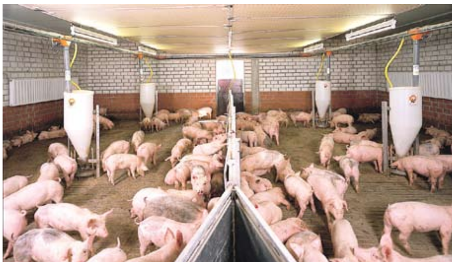
Existe un gran misterio respecto del origen de la cepa viral. El nuevo influenza A/H1N1 sería el resultado de la recombinación genética entre virus porcinos de dos continentes diferentes. Pero no se sabe cómo pudieron haberse juntado cerdos de lugares tan distantes, y todavía no hay pruebas de que el nuevo virus haya estado alguna vez en un cerdo.

Pero el virus de la influenza A tiene otro mecanismo -más brusco- de variabilidad que, ocasionalmente, le permite dar el "salto de especie". Es que, como su genoma está segmentado en ocho moléculas de ARN, se pueden producir intercambios de esos fragmentos entre diferentes subtipos virales: "Si dos virus distintos infectan una misma célula existe la probabilidad de que sus moléculas de ARN se mezclen y que surja un nuevo subtipo", señala la experta.