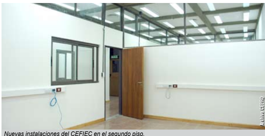
Nuevas instalaciones del CEFIEC en el segundo piso.

- Por un lado, toda la readecuación de la instalación de gas de todos los pabellones. En el 2007 habíamos hecho un relevamiento de todo el Pabellón II para ver el estado de la instalación; el profesional matriculado había certificado que la instalación estaba en condiciones pero que había que hacer adecuaciones por los cambios de la norma vigente en los últimos 40 años. Por ejemplo, para poder tener en un laboratorio un mechero, Metrogas requiere ciertas medidas, ciertos controles que no