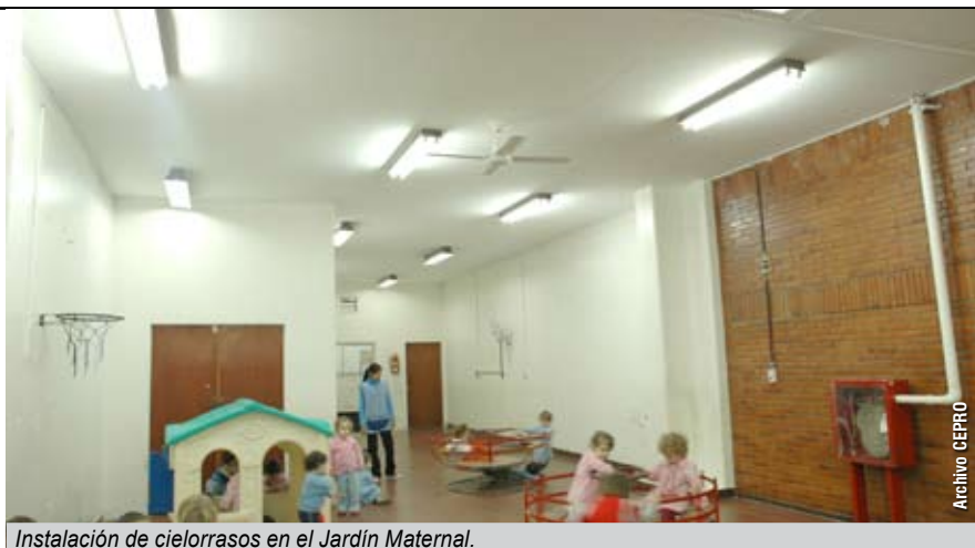
Instalación de cielorrasos en el Jardín Maternal.

- Todos los fondos los pudimos obtener porque teníamos pliegos listos para ser presentados de manera inmediata. De