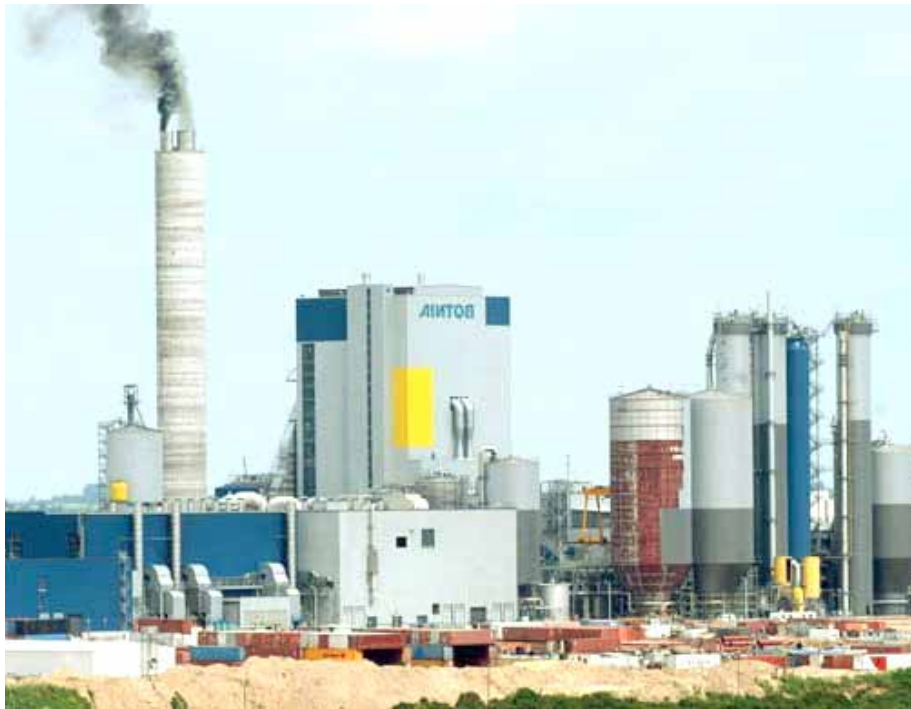
Pág. 2 ▶

Investigadores de Exactas proveyeron información acerca de los efectos de Botnia sobre el medioambiente de acuerdo a la comparación con la línea de base establecida en 2007. Los datos del río fueron considerados insuficientes para probar contaminación. Respecto al aire, la Corte consideró que la evaluación de esa variable no era de su jurisdicción. Aquí, las conclusiones.