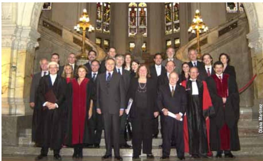
Delegación completa de la Argentina durante los alegatos en la Corte Internacional de La Haya.

A los limnólogos también les tocó analizar una aparición que llegó rápido a la tapa de todos los medios nacionales y trajo preocupación a los pobladores de Gualaguaychú: la ya famosa mancha blanca que se registró en las aguas el 4 de febrero de 2009. Ese día, las condiciones del río Uruguay eran calmas y, de acuerdo al registro de los investigadores, "la superficie del agua mostraba en ese momento un cúmulo flotante de varios kilómetros de superficie desde la zona frente a Botnia". La "mancha" resultó ser una floración de algas verdeazules, conocidas como cianobacterias, cuya magnitud no tuvo precedentes para el canal principal del río Uruguay. "La abundancia de algas alcanzó 18 millones de células por ml, lo cual excede el nivel indicado por la Organización Mundial de la Salud como nivel de alerta 3, peligroso para la salud humana". Esta abundancia de algas fue mil veces mayor que el máximo histórico registrado en el río Uruguay. "Cabe señalar que estas algas producen cianotoxinas que se liberan particularmente cuando hay roturas celulares como las que se observaron al analizar las muestras del cúmulo al microscopio", indican los investigadores y especifican que, "combinados con la floración algal, se observaron productos que estarían asociados a los efluentes de la planta". El Laboratorio de Anatomía y Embriología Vegetal de la Facultad