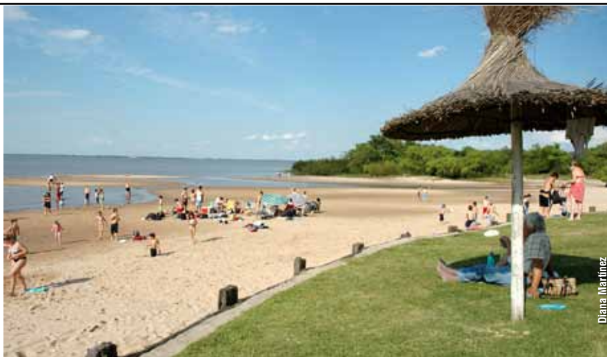
Frente a la planta de Botnia se encuentra el balneario de Ñandubaysal, un importante sitio turístico de la Provincia de Entre Ríos.

Sin embargo, con la planta en marcha se detectaron cambios. “De acuerdo a las