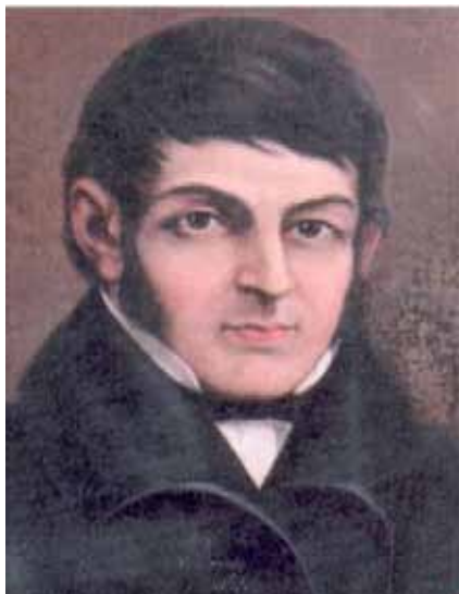
Javier Crisóstomo Lafinur

El Colegio Monserrat, bajo la tutela de la Universidad de Córdoba, estaba dirigido por el Deán Gregorio Funes, un cura fuertemente comprometido con la revolución y con la ciencia. Funes fue ordenado sacerdote en 1733, y estrenando sotana participó de un movimiento contra el obispo de Córdoba que le costó ser designado cura párroco en medio del Valle de Punilla. Sin esperar autorización, el joven sacerdote abandonó su puesto y marchó a estudiar a España donde se estaba dando un fenomenal movimiento a favor de la ilustración. Convivían en la península una España que deseaba po-