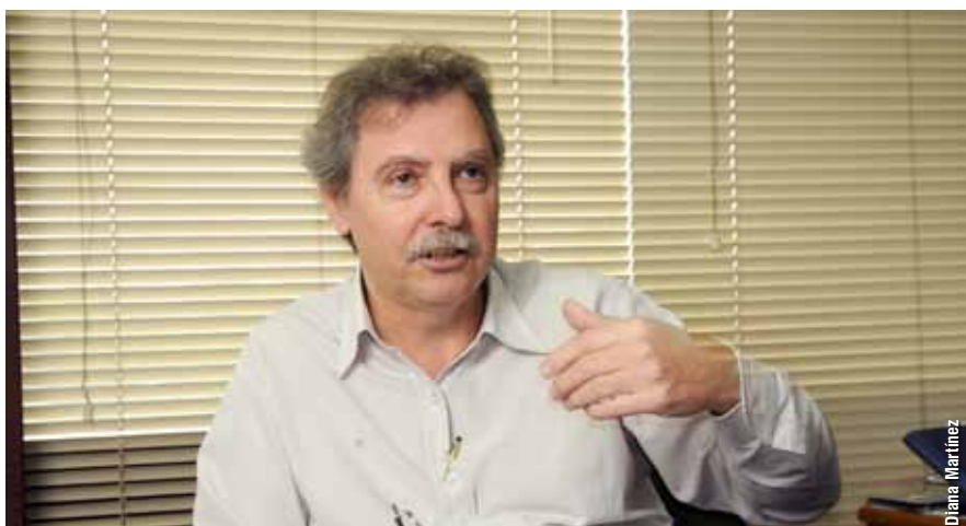
En 2008 hubo un problema por contaminación en partidas de heparina. El UMYMFOR cuenta con el único equipo RMN de 500 MHz del país capaz de identificar esas impurezas. "En el último año y medio analizamos cientos de muestras y, de hecho, tuvimos que rechazar una cantidad importante que no pudieron llegar al mercado", relata Burton.

- De hecho cuando empezamos no era muy bien visto. Pero desde hace algunos años empezó a pensarse que era importante que todo este equipamiento e inversión que hacía el Estado pudiera también ser utilizada por el sector privado para contribuir al desarrollo productivo. ▀