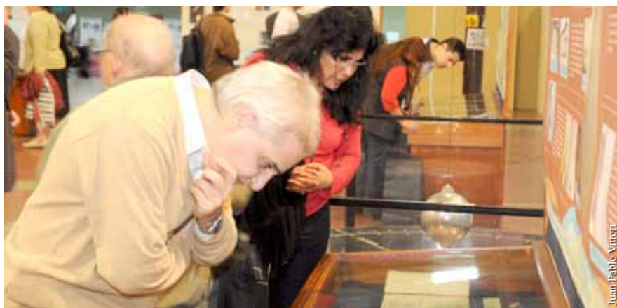
“Yo quisiera resaltar el valor de estar frente a libros que fueron impresos hace más de doscientos años en Europa. Que tal vez pasaron por las manos de Belgrano para finalmente llegar a la Biblioteca de la Facultad. Yo creo que esos libros son ejemplos materiales que permiten percibir la larga tradición de la ciencia en Argentina”, se entusiasma Guijarro.