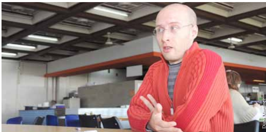
"La biología actual tiene mejores medios técnicos y produce una cantidad de datos que es un millón de veces mayor que hace unos años. El cambio cuantitativo es tan grande que por fuerza provoca un cambio cualitativo. No es lo mismo cazar cien mariposas y examinarlas que analizar la expresión de 50 mil genes", sostiene Sánchez.

- En el país la bioinformática no forma parte integral de ningún campo de la biología y creo que en todos ellos puede hacer un gran aporte. Hay que tener en cuenta que en Europa y Estados Unidos ya no se considera a la biología tradicional por un lado y la bioinformática por otro. Lo computacional está integrado en cualquier proyecto biológico. Es un camino que no tiene retorno. ▀