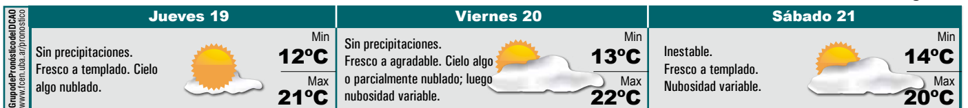
Pág. 6 ►

A pesar de que se estudia desde tiempos remotos, todavía es mucho lo que se desconoce acerca del Sol. Dentro del Grupo de Flujos Astrofísicos, Sergio Dasso dirige la línea de investigación en heliofísica y geofísica espacial y alta atmósfera, que se dedica principalmente a indagar en diferentes aspectos de la física de plasmas y fluidos espaciales.