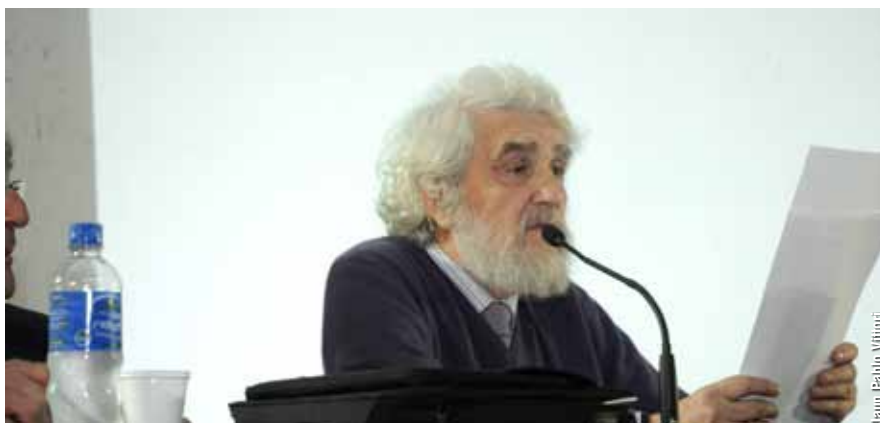
“Cuando llegó la Mercury a Buenos Aires, en 1961, este tipo de máquina acababa de aparecer. En Argentina se estaba todavía a tiempo de participar en el desarrollo mundial de esta nueva ciencia y tecnología. Era un momento en el que se estaba a nivel mundial”, reflexiona Camarero.

Al principio, dar a conocer los servicios que podía brindar el IC era una prioridad. Según recuerda Camarero, para dar los cursos iniciales de programación se había invitado, por un lapso de tres meses, a la