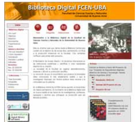
Pág. 4 ►

A un año de su aparición en la web, la Biblioteca Digital de la Facultad creció fuerte tanto en la cantidad de materiales que ofrece libremente como en el número de consultas que recibe. Desde Europa mostraron interés por algunas de las tesis doctorales ya publicadas. El próximo paso es avanzar sobre los papers.