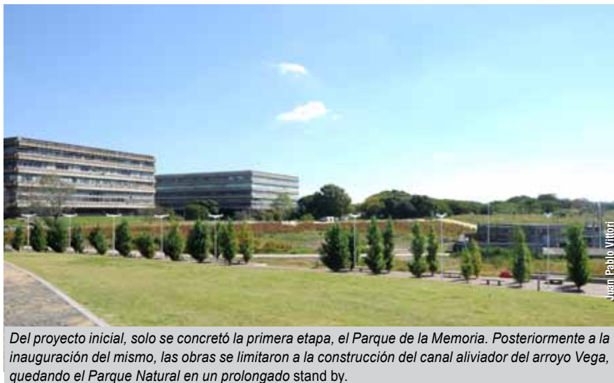
Del proyecto inicial, solo se concretó la primera etapa, el Parque de la Memoria. Posteriormente a la inauguración del mismo, las obras se limitaron a la construcción del canal aliviador del arroyo Vega, quedando el Parque Natural en un prolongado stand by.