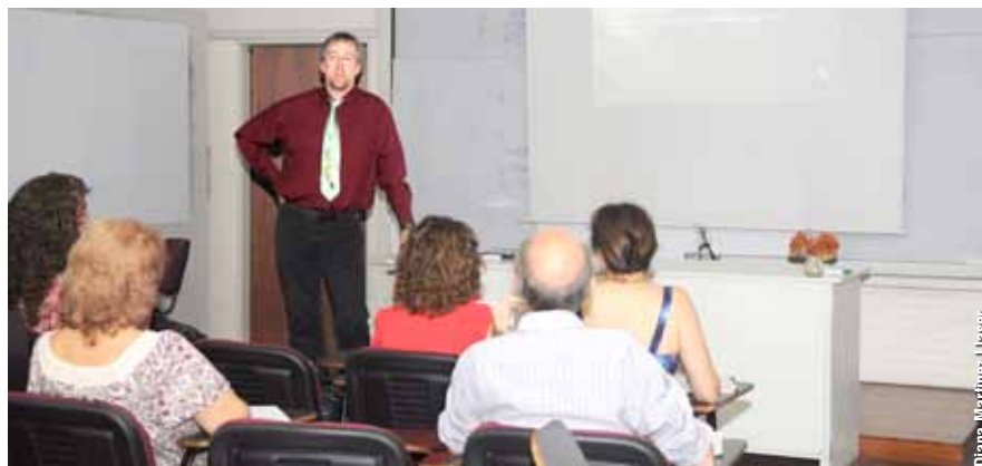
Ruthenberg señaló que antes del 1800 la química era una rama complementaria de la medicina y la farmacia. "Recién en el siglo XIX la química se convierte en una disciplina independiente, y es tomada seriamente en las discusiones científicas. Ya a partir del 1900, era una ciencia prolífica y exitosa desde el punto de vista industrial", afirmó el químico.

La primera de las definiciones homologaba a la química con la alquimia, y la definía como la disciplina encargada de descomponer, mezclar o unir sustancias de acuerdo con determinados principios. Esta definición era típica de los tiempos previos a Lavoisier. "Yo la considero como