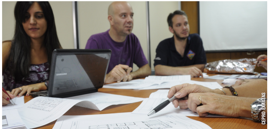
"La nueva conexión de internet y de telefonía se irá habilitando por sectores, de acuerdo al avance de obra. Al respecto, están definidas dos etapas. En primer lugar, Bioterio, Industrias, Campo Experimental y Pabellón II. En segundo, Pabellón I, IAFE e INGEIS. La instalación se completaría en el segundo semestre de 2014", afirman desde la UTI.

Para optimizar la estabilidad del sistema, la conexión central de fibra óptica va a estar conformada por dos canales totalmente distintos y separados espacialmente. Si se cortara una de las conexiones por cualquier motivo, la otra entrada salva el problema. Como dato destacado, la telefonía se basará en la conectividad vía fibra óptica.