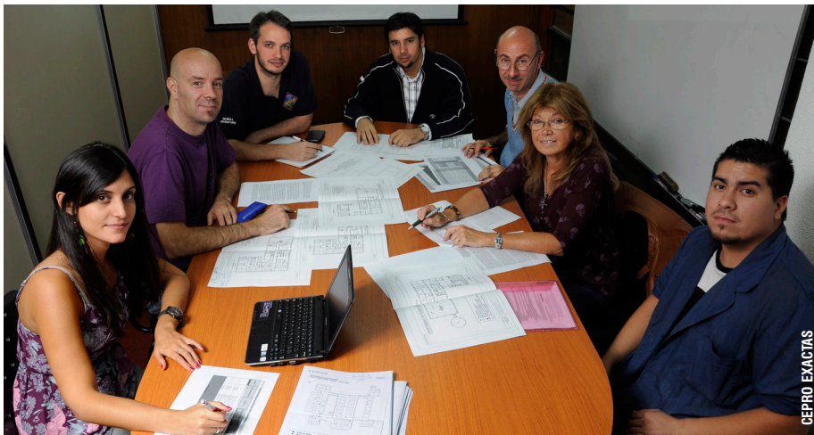
Pág. 3 ▶

Ya está en marcha el nuevo cableado de fibra óptica para toda la UBA. Pronto comenzarán las obras de reemplazo completo de redes internas en todas las unidades académicas, lo que implica un cambio rotundo en la tecnología de telefonía, que será vía Internet. El responsable de la Unidad de Tecnologías de la Información de Exactas explica los alcances en la Facultad.