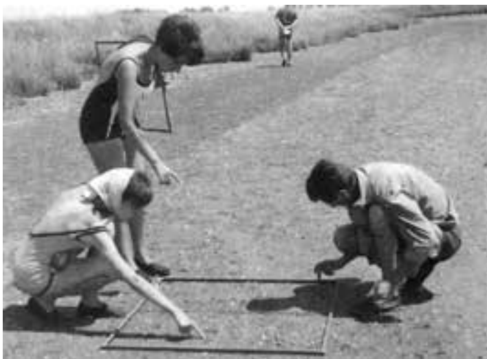
Figura 7. Laguna de Mar Chiquita; estudiantes realizando censos ecológicos (1967).

El IBM inició así el estudio de un ecosistema marino poco conocido desde un punto de vista ecológico y la evaluación de recursos pesqueros de gran importancia para la economía pesquera del país, como, anchoíta, caballa, merluza, bonito, camarón, langostino, vieira, mejillón, calamar e invertebrados varios. Como fruto de esas investigaciones, se dio a conocer una serie de publicaciones conocidas con el nombre de “Contribuciones del Proyecto Pesquero” (FAO) de la Argentina, que también engrosaron la serie “Contribuciones Científicas” del IBM. Se desarrolló así