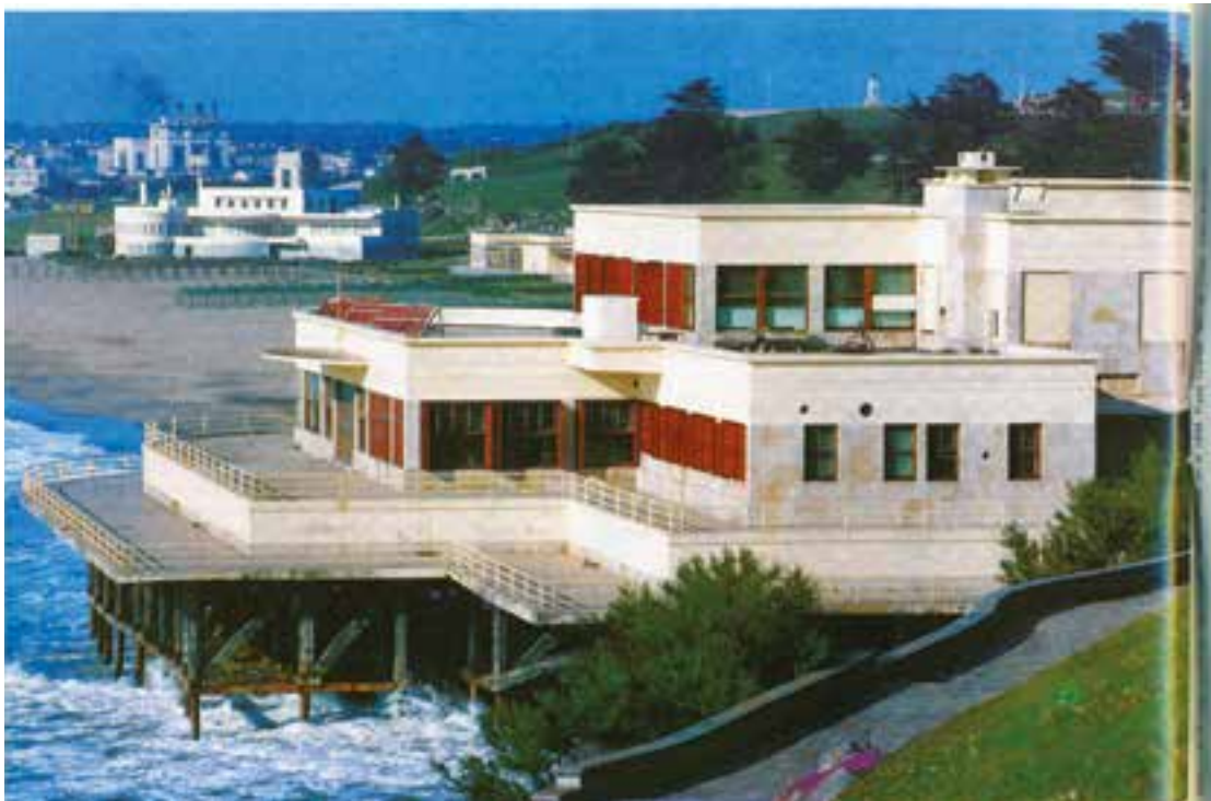
Figura 1. Vista lateral del Instituto de Biología Marina, Playa Grande Mar del Plata (1962).

Por diversas razones geopolíticas, como antecedentes de esa actividad no planeada y que forma hoy la historia de la biología marina, tanto el océano Atlántico como el Pacífico Sur fueron objeto de expediciones científicas desde mediados del siglo XIX en adelante. El continente antártico fue siempre un objetivo estratégico por su enclave y los posibles recursos naturales –renovables y no renovables– que pudiese albergar. Las aguas aldeañas a los mares antárticos hasta la actualidad han sido un reservorio de fauna y flora, además de posibles recursos minerales y energéticos, que estuvo