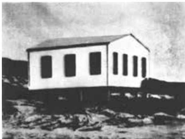
Figura 2. Estación de biología marina en Punta Mogotes, Mar del Plata fundada en 1898 por la Universidad de La Plata.

Argentina recibe el impacto y el impulso del industrialismo y de la corriente filosófica denominada “positivismo” imperante en esa época. Sus recursos naturales escasamente conocidos comenzaron a ser de indudable valor en las economías tanto regionales como locales y materias primas para el intercambio, especialmente con los países europeos coloniales. Se plasma así la necesidad de efectuar el relevamiento de los recursos tanto terrestres como marinos. La tradición de los famosos museos europeos sirvió de punta de lanza para que naturalistas viajeros hicieran los primeros viajes exploratorios. Dentro del